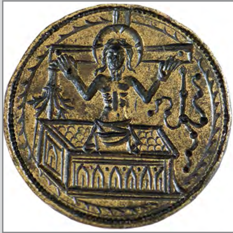
Bronzesiegel des Burgkaplans