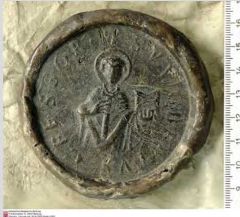
Siegel des Rentwich de Hohenburg, 1162