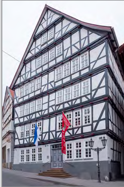
Engelapothek, Sitz des Burgbergmuseums seit 2019