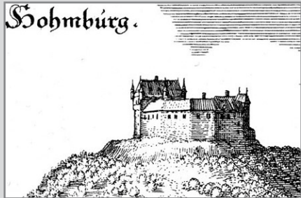
Merian, Burgansicht 1605

Das Museum wird gegründet und im November 2004 in der Freiheiter Straße 26 eröffnet. Ein prächtiges neues und endgültiges Quartier findet das Mu- seum am Marktplatz 16 am 15.3.2019 in der ehemaligen Engelapotheke.