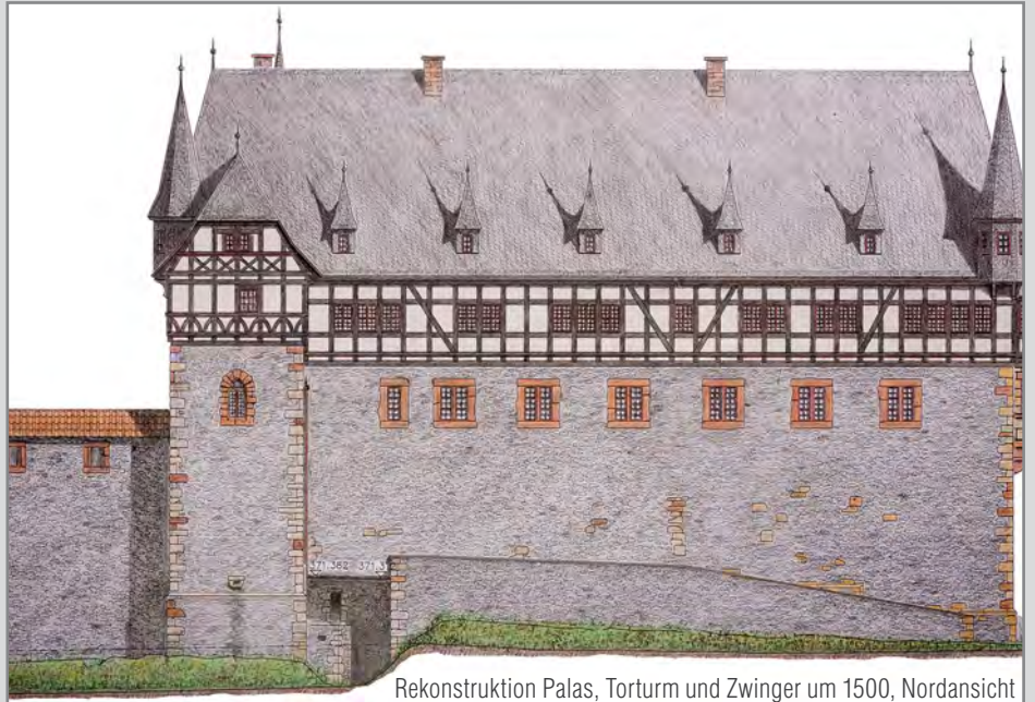
Rekonstruktion Palas, Torturm und Zwinger um 1500, Nordansicht