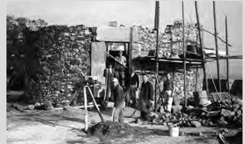
1952-58 Homberger Bürger bauen sich einen Bergfried