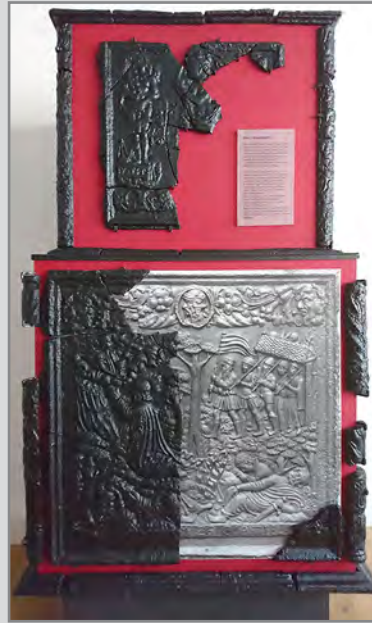
Ofenplatten, Fundstücke aus dem Brunnen

Weiter werden Keramiken, Werkzeuge und Gefäße gezeigt, die einen Einblick in das mittelalterliche Burgleben geben. Schwerpunkt sind hier jedoch die eisernen Ofenplatten, die in noch gut erhaltenem Zustand an der tiefsten Stelle des Brunnenschachtes geborgen und deren Herkunft, Hersteller und Alter nach intensiver Forschung ermittelt werden konnten. Die Platten sind zu einem Ofen zusammengefügt, bildliche Ergänzungen ersetzen fehlende Teile.