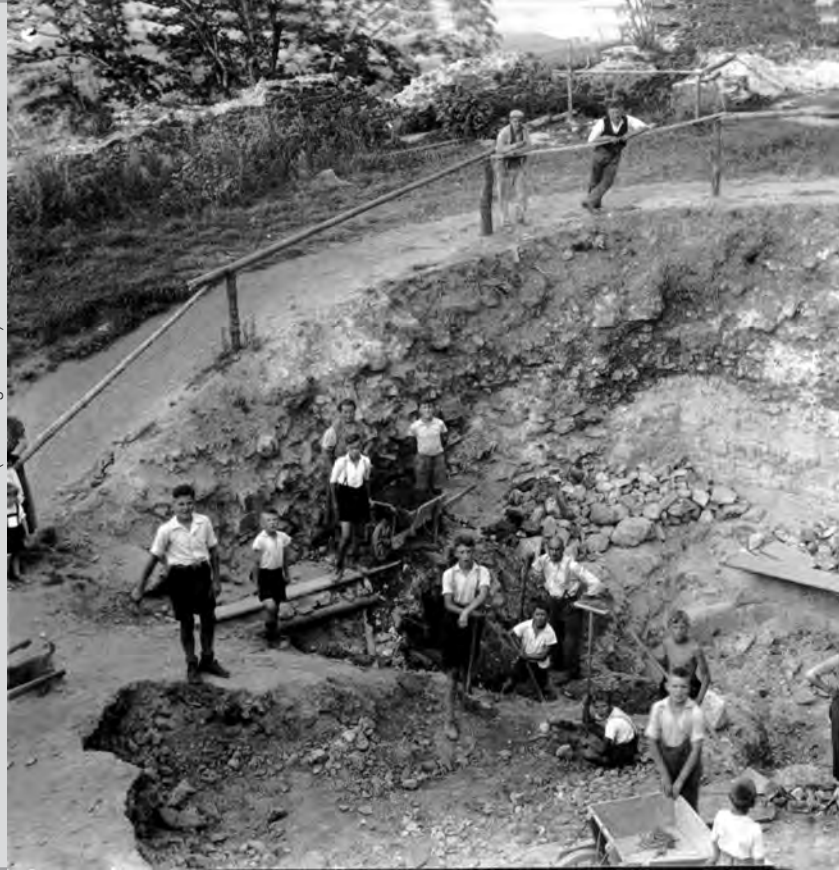
Ausgrabungen am Brunnenhaus in den 1930ern daneben das Brunnenhaus heute (mit Burgmodell)

Hier sind auf einem Monitor alte Fotografien von den Ausgrabungsarbeiten der Burg zu sehen. Ab 1936 räumten geschichtsbewusste Homberger den Schutt der Jahrhunderte ab, legten nach alten Ansichten und Grundrissen Mauern, Treppen und das Brunnenhaus frei. Auch den Bau des Burgturms (1952 bis 1958) illustrieren alte Fotografien. Wir empfehlen einen Aufstieg auf die Burg. Von dort oben genießt man einen herrlichen Blick in die nordhessische Landschaft mit Dutzenden von Dörfern und ausgedehnten Wäldern. Im Dezember leuchtet der Turm als riesige Adventskerze weit ins Land.