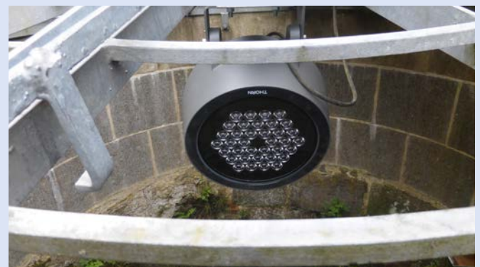
Die neue LED-Lampe.