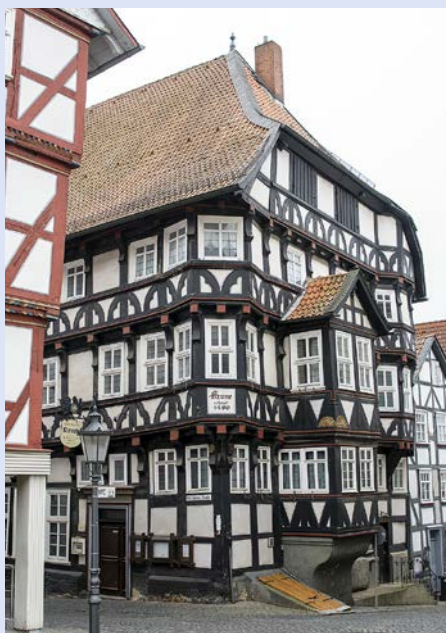
Die „Krone“ heute

Sartorius, Wassermann, Fuchs und Tigges – denen die Anordnung des Homberger Kreisamts aus dem Jahr 1830 missfiel, ihrerseits mit einer Beschwerde, worauf den Schankwirten vom Homberger Kreisamt bei Strafe von fünf Talern außer einem schlichten Handkäse der Verkauf von Speisen verboten wurde.