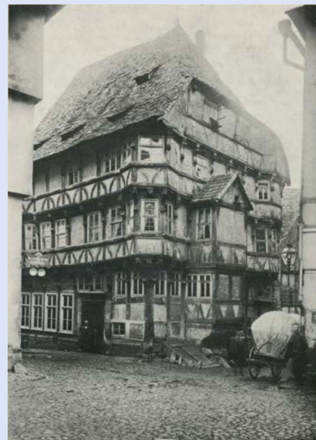
Die „Krone“ um 1890