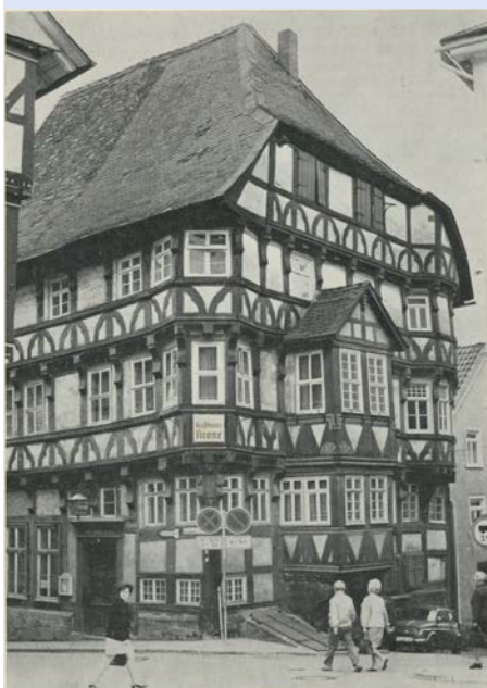
Die „Krone“ Anfang 1972